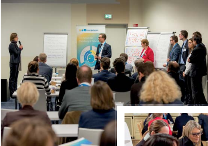
Leitung und Moderation des Workshops

Das Komplettpaket für die maximale Aufmerksamkeit bei Ihrer Zielgruppe!