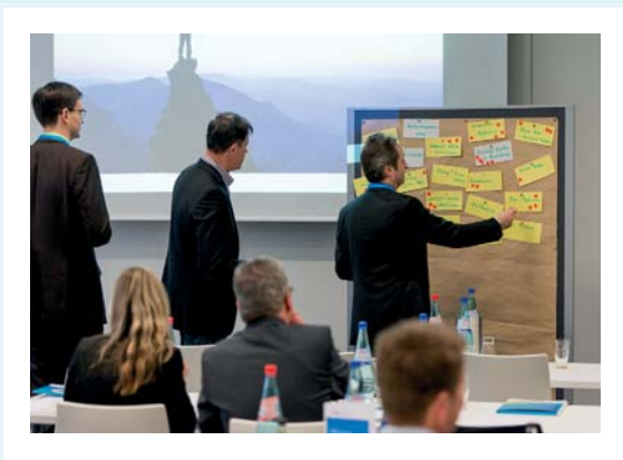
Interaktion mit den Teilnehmern