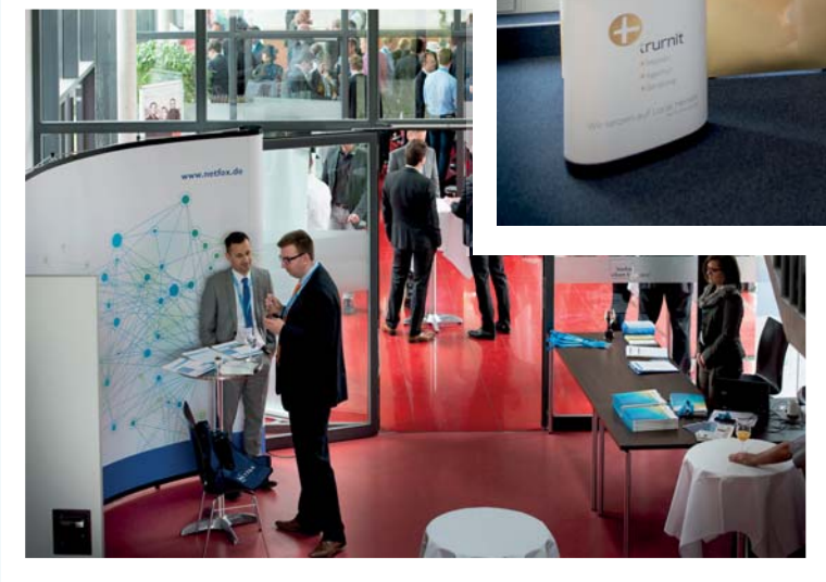
Blick ins Foyer