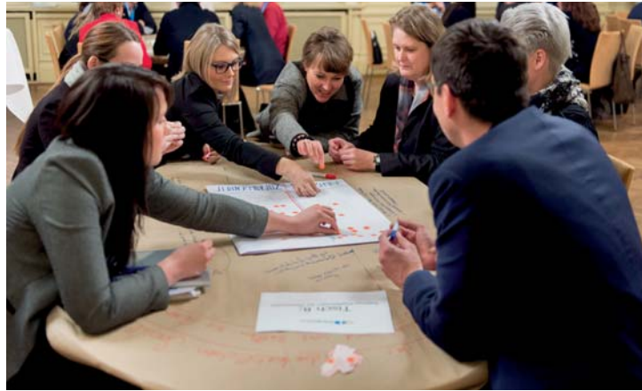
intensiver Austausch u.a. innerhalb der Arbeitsphasen

Das Komplettpaket für die maximale Aufmerksamkeit bei Ihrer Zielgruppe!