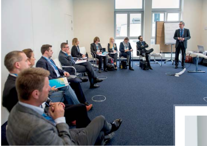
Moderation eines Workshops

Das Paket für die persönliche Interaktion mit interessierten Teilnehmern!